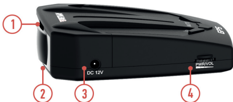
СХЕМА УСТРОЙСТВА РАДАР-ДЕТЕКТОРА