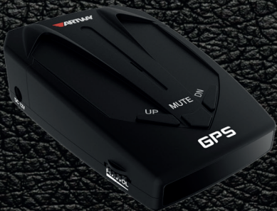
АВТОМОБИЛЬНЫЙ РАДАР-ДЕТЕКТОР RD-200