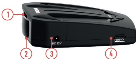
СХЕМА УСТРОЙСТВА РАДАР-ДЕТЕКТОРА