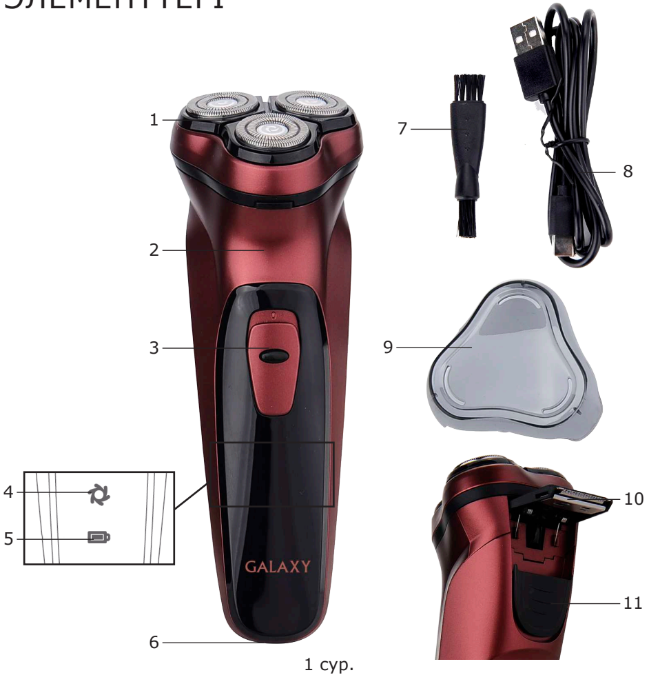
1 сур. Электр құралының элементтері (1 сур.)