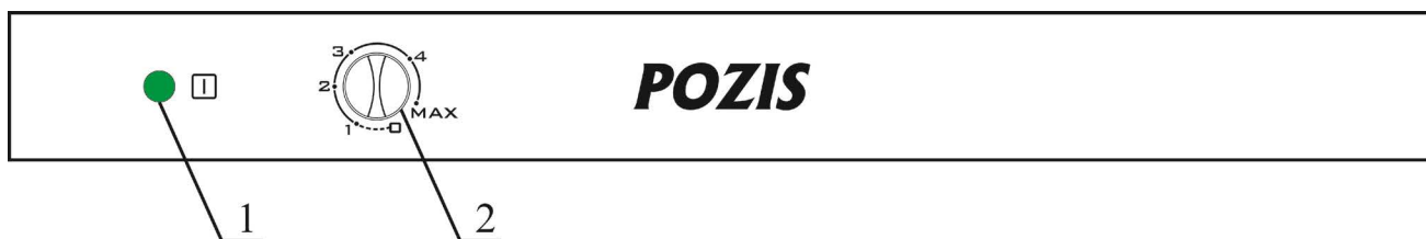
Рис.2 Регулировка температурного режима

После выхода в режим ручку терморегулятора переведите в положение «3». В процессе эксплуатации Вы можете регулировать температуру следующим образом: при чрезмерном охлаждении продуктов в холодильной камере ручку терморегулятора поверните против часовой стрелки, при недостаточном охлаждении - по часовой стрелке.