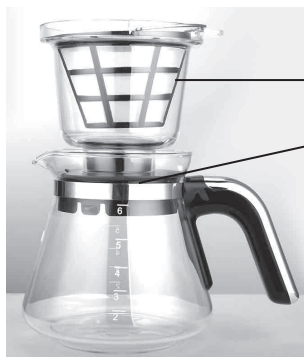
Воронка (дриппер) с фильтром