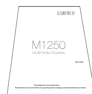
Инструкция по эксплуатации