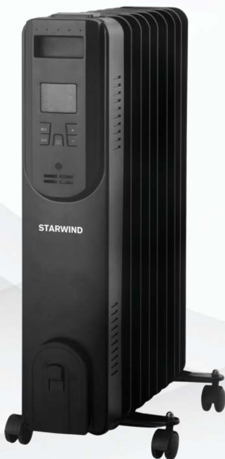
Радиатор масляный SHV5710