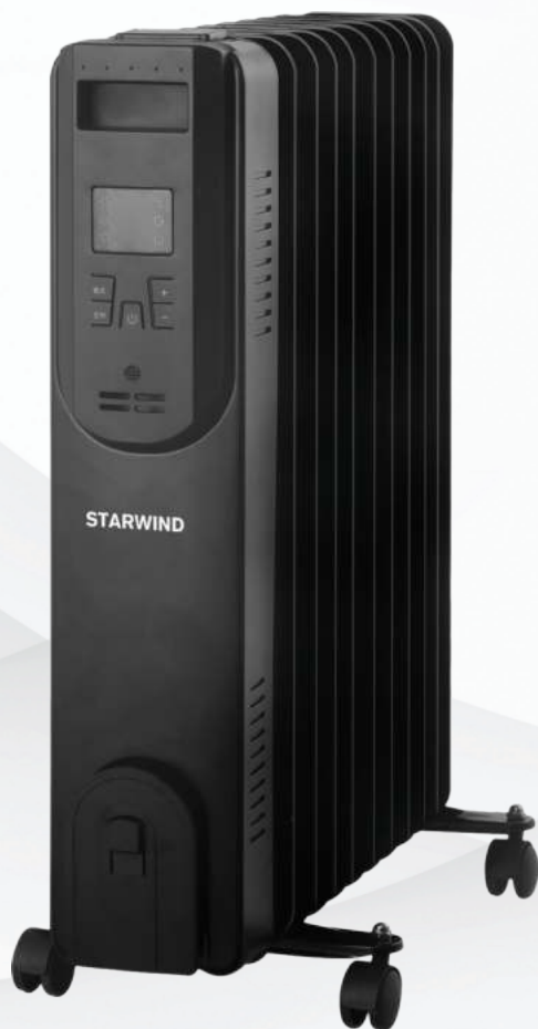
Радиатор масляный SHV5915