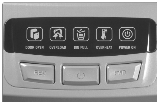
▲ Кнопки переключения режимов