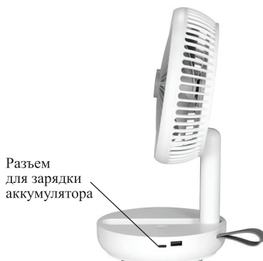
Разъем для зарядки аккумулятора