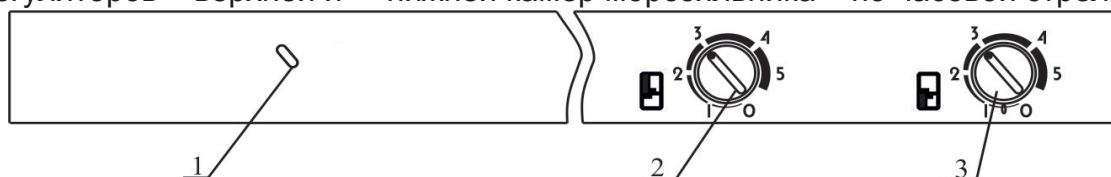
Рис.2 Схема расположения элементов управления и сигнализации 1 – зеленая индикаторная лампа (сеть); 2 – ручка терморегулятора верхней камеры морозильника; 3 – ручка терморегулятора нижней камеры морозильника

7.4 Продукты для замораживания загрузите в корзины, маркированные *(***), переведите ручки терморегуляторов в положение «5». Для этого поверните ручки терморегуляторов верхней и нижней камер морозильника по часовой стрелке до