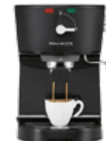
Кофеварки и кофемашины