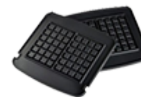
Аксессуары к электрогрилям, аэрогрилям, тостерам