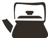
Стальной или эмалированный чайник