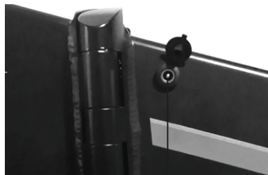
Аккумулятор зарядтау порты