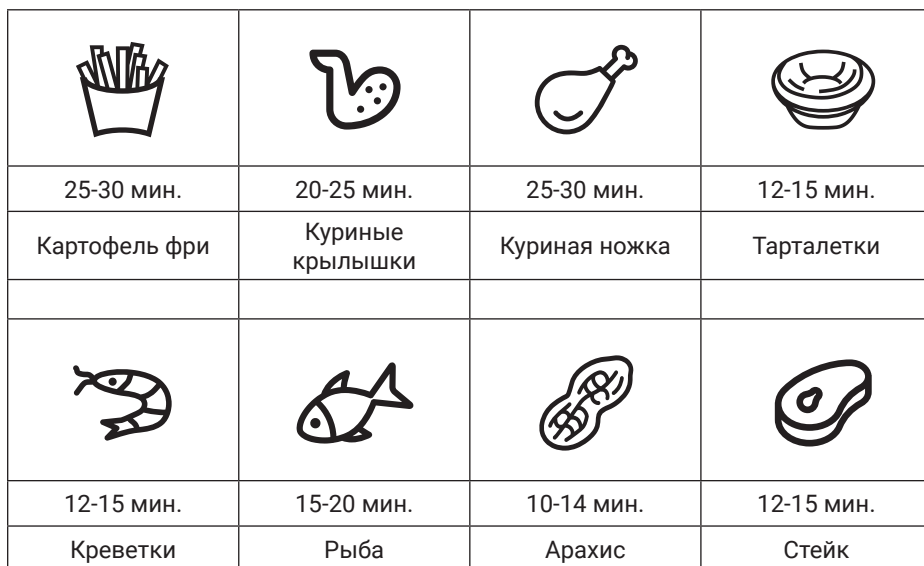
Таблица с рекомендациями

Примечание: время приготовления в таблице указаны приблизительно: конечное время будет зависеть от количества, качества и температуры использованных ингредиентов.