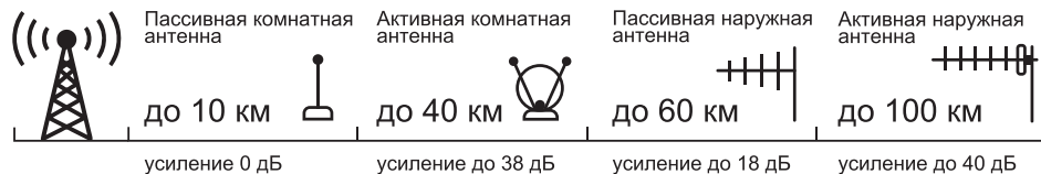
СХЕМА ДАЛЬНОСТИ РАБОТЫ АНТЕННЫ