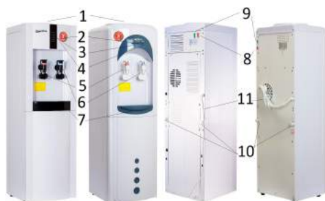
Модель 16 LDR, 16 TDR, 17 LDR