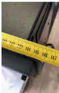
Ширина – 95 см (включая крепежные выступы).