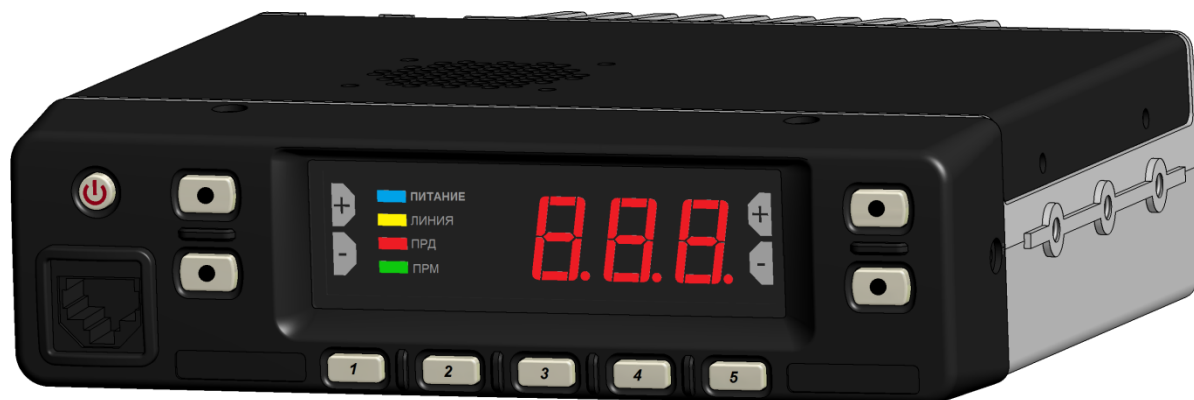
Рисунок 1 – Внешний вид приёмопередатчика радиостанции «Аргут РК-201М»

Внешний вид радиостанции представлен на рисунке 1