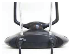
Кабель для подключения электропитания