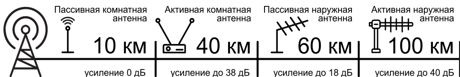
Схема дальности работы антенны