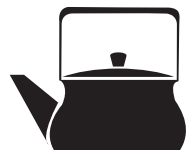
Құрамында темірі аз қорытпадан жасалған ыдыс