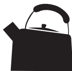
Шәйнек (эмаль /тот баспайтын болат)