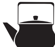
Посуда из сплава с низким содержанием железа (алюминиевая и пр.)