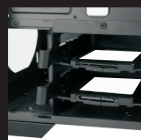
Поместите салазки с SSD в корзину для жестких дисков