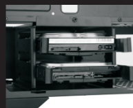
Разместите салазки с SSD в корзину для жестких дисков