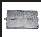
Порты SSD x 2