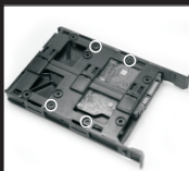
Поместите HDD в соответствующий слот