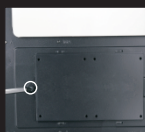
Расположение SSD на задней панели материнской платы (1)