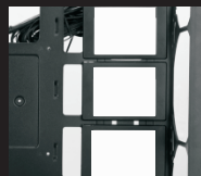
Установите SSD на место