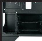
Расположение SSD в салазках HDD (2)