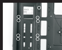
Установите SSD на место