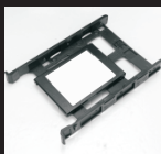
Поместите SSD в салазки