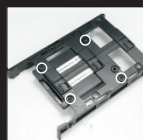
Закрепите SSD на салазках при помощи винтов