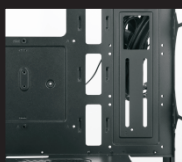
Порты SSD x 3 (2)