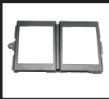
Зафиксируйте SSD на крепежном кронштейне при помощи винтов