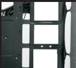
Установите SSD на место