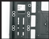
Установите SSD на место