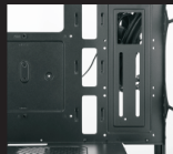
Порты SSD x 3 (2)