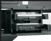
Разместите салазки с SSD в корзину для жестких дисков