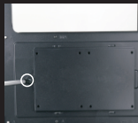
Расположение SSD на задней панели материнской платы (1)