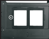
Установите крепежный кронштейн с SSD на место