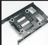
Закрепите SSD на салазках при помощи винтов