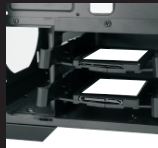
Разместите салазки с SSD в корзину для жестких дисков