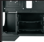
Расположение SSD в салазках HDD (2)