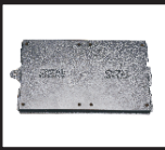
Порты SSD x 2