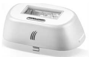
Дополнительный картридж для тела на 150.000 импульсов