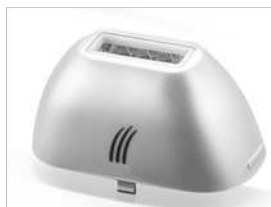
Дополнительный картридж для лица на 30.000 импульсов