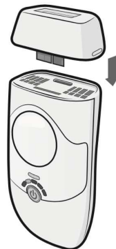
Схема обработки зависит от типа кожи и выбранного уровня. Определите соответствующий уровень по приведенной выше таблице или по результатам локального теста, придерживайтесь изложенных ниже рекомендаций. Выполняйте те же действия в порядке, описанном выше. Будьте аккуратны и следите за тем, чтобы не обрабатывались родинки и губы. Для защиты участков, требующих особенно осторожного обращения, по необходимости используйте белую подводку для глаз или куски бумаги.