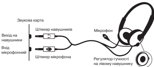
Мал. 1. Схема підключення