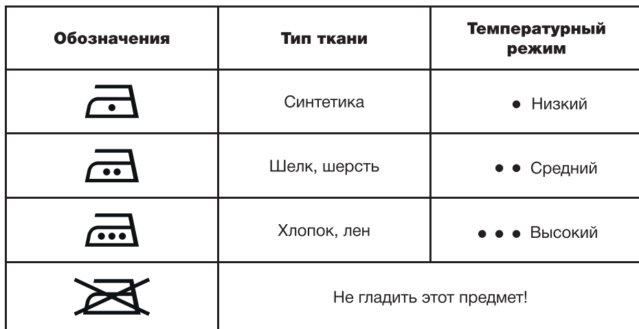
Таблица может быть использована только для гладких тканей. Если на ткани присутствует рельеф, оборки, нашивки и прочие декоративные элементы, рекомендовано производить глажение при низких температурах.

Перед началом работы изучите информацию о допустимых режимах глажения на ярлыке изделия. В случае если ярлык с рекомендациями отсутствует, но известен материал изделия, обратитесь к таблице.